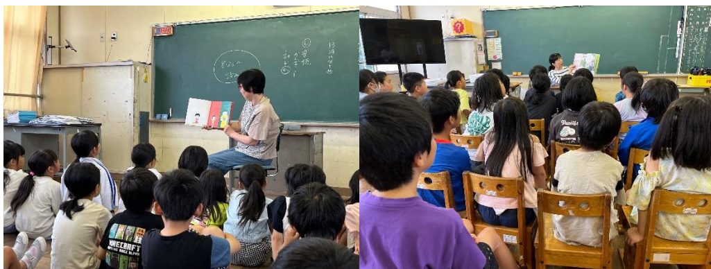
絵本の絵も近くで見ることができ、子どもたちの反応も大きなものになっています

6・7月、ボランティアさんによる「朝のよみきかせ」をしていただきました。5月のときには、席にすわって聞いていた子どもたちでしたが、6月からは、コロナ禍前のように、教室の床にすわったり、イスにすわったりすることにしました。ボランティアさんには、子どもたちの近くで絵本を読んでいただくことができるようになりました。